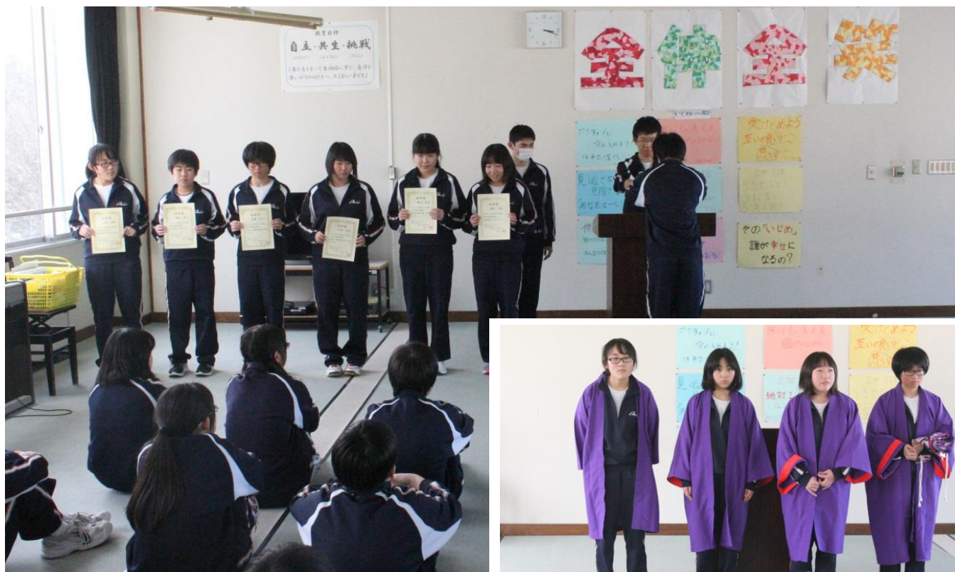
平成29年度生徒会長による執行委員と専門委員長の委嘱（上）と平成29年度よさこいリーダーによる決意表明（右）

新年特別号発行時はほとんど雪のなかった校舎回りですが、1月13日（金）からの降雪で、一気に雪国らしくなりました。雪国なので雪があって当然とはいうものの、交通面や健康面では雪のない時期に比べて配慮すべきことがたくさんあります。子どもたちが健康で安全な生活を送るために、保護者や地域の皆様からのご理解とご協力をお願いいたします。