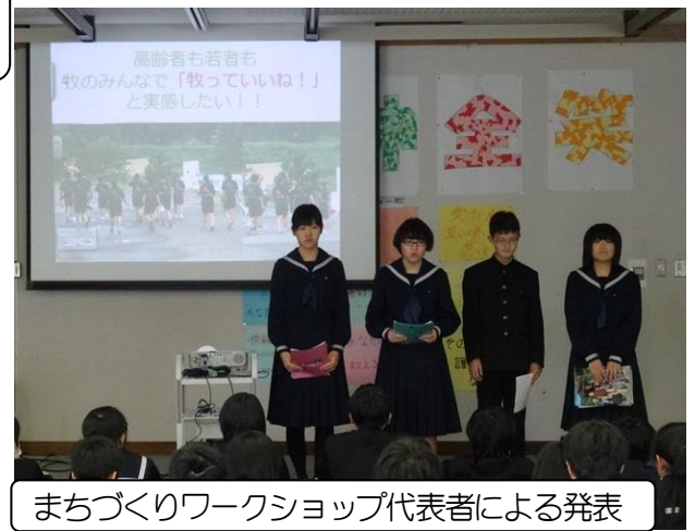
まちづくりワークショップ代表者による発表

2016年が終わります。この1年間、牧を熱くしたものがたくさんありました。牧振興会が中心となって行っている「まちづくり活動」では牧中生がボランティアとして運営をお手伝いし、大いに活躍しました。加えて、地域青少年育成会議（牧では「牧っこを育てる会」）の事業「中学生まちづくりワークショップ」での提案を具体化した活動を行いました。また、地域の祭りやイベントでは「よさこい披露」で場を盛り上げ、参加者からとても喜んでいただきました。そうです、牧を熱くするのは「牧中生」です。