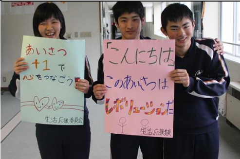
生活応援委員会の「あいさつ+1」PR

選挙運動と立会演説会を経て、来年度の生徒会長は〇〇〇〇さん、副会長は〇〇〇〇さんに決定しました。3年生の思いを引継ぎ、在校生をリードしてください。