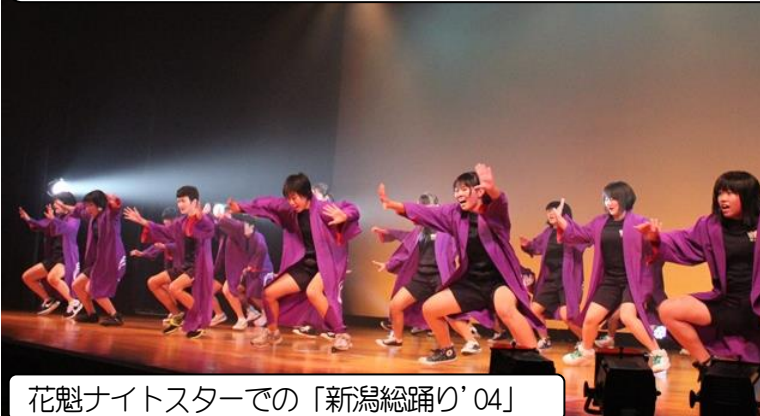
花魁ナイトスターでの「新潟総踊り'04」

12/9付の「上越タイムス」で、文部科学大臣表彰式の様子とこれまでの取組概要について、大きく紹介いただきました。