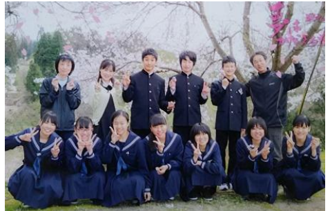
桜満開の下、春を愛でる3年生

常勤ではありませんが、左に紹介する4名が、週に一回程度生徒の授業を担当します。その他にも、スクールカウンセラー、栄養教諭、学校司書、学習情報指導員が定期的に来校します。