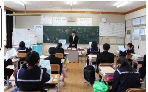
上) 初学活でドキドキの1年生 下) 校舎周辺で春探しの2年生