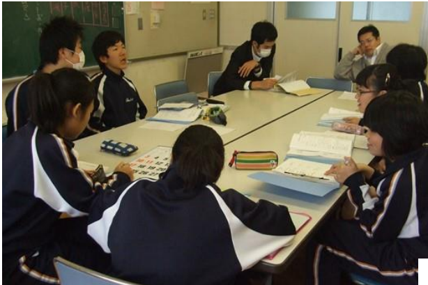
H27年度の生徒会活動の反省を次世代へ引き継いで・・・