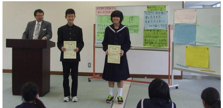
人権に関する標語の優秀作品表彰！ 漢字検定準2級合格！