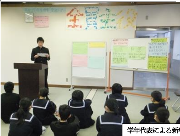
学年代表による新年の抱負発表