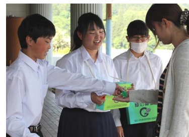
生徒会による募金活動の様子