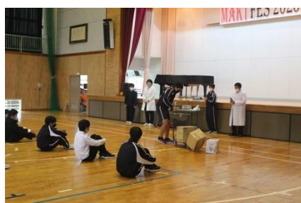
Use of science