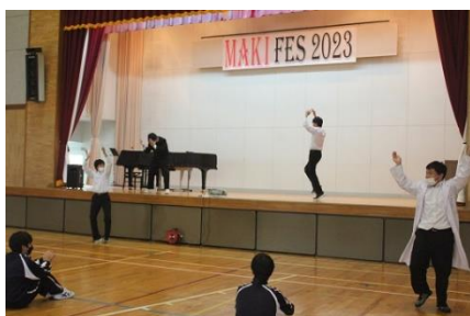
首なし人間パート1