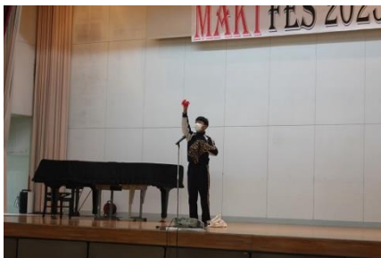
リベンジマジック